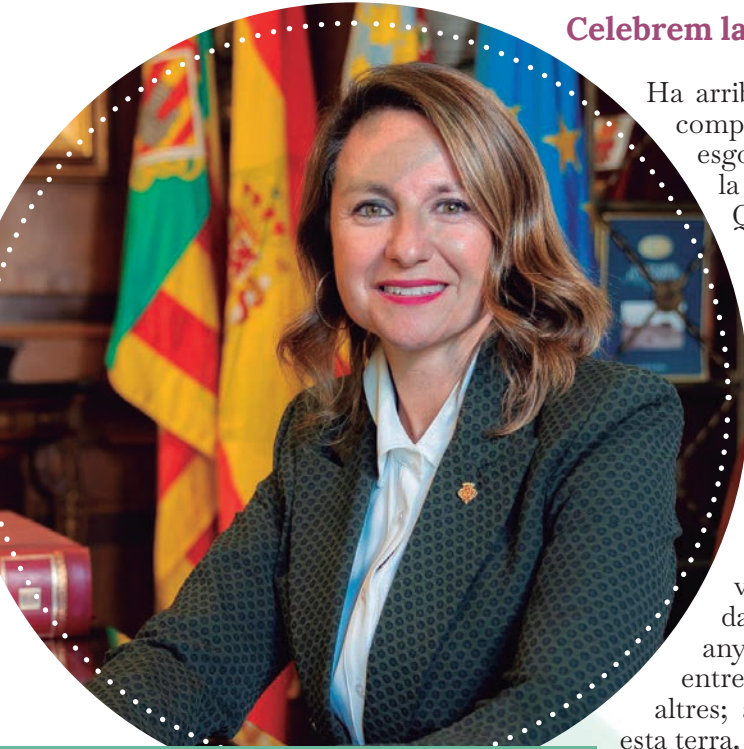
BEGOÑA CARRASCO Alcaldeessa de Castelló

Ha arribat el nostre moment, és l'hora. El compte arrere en el rellotge de les emocions esgota la seua recta final. Puntual a la seua cita, el tercer Diumenge de Quaresma ens convida a celebrar la vida a la vora del Mediterrani i a mostrar al món sencer el millor de la nostra tradició.