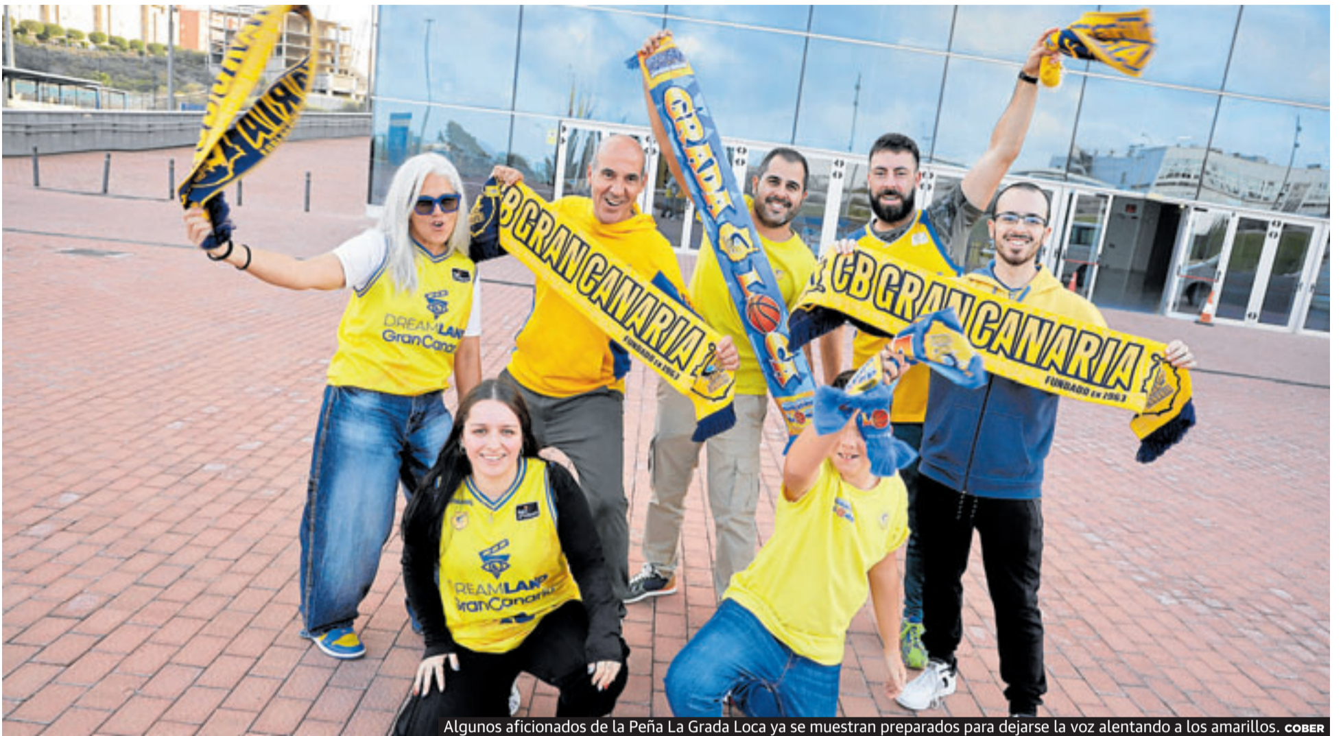
Algunos aficionados de la Peña La Grada Loca ya se muestran preparados para dejarse la voz alentando a los amarillos.