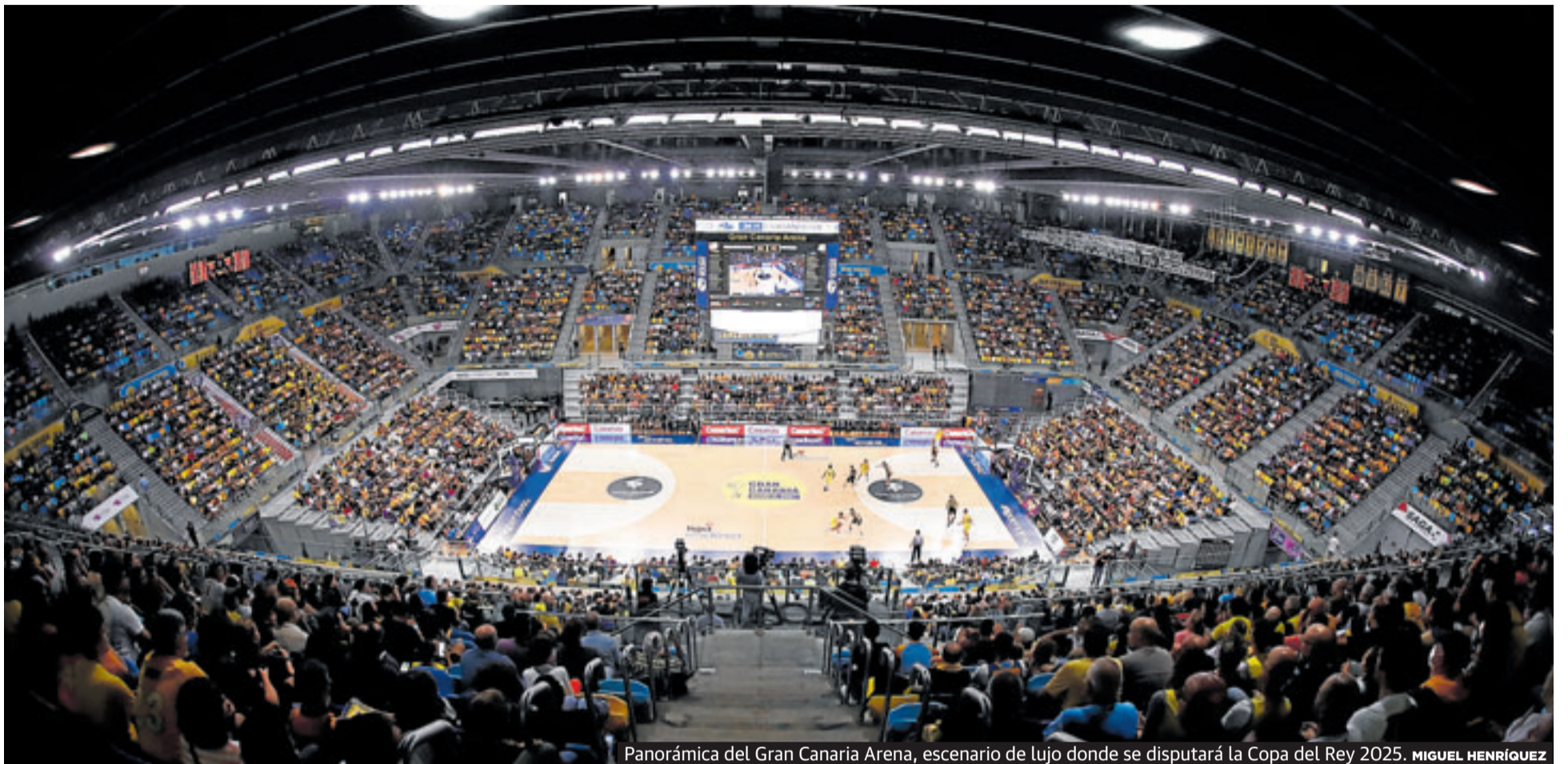
Panorámica del Gran Canaria Arena, escenario de lujo donde se disputará la Copa del Rey 2025. MIGUEL HENRÍQUEZ