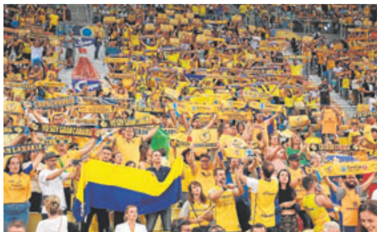
La afición reventó el recinto de Siete Palmas en la final de la EuroCup.